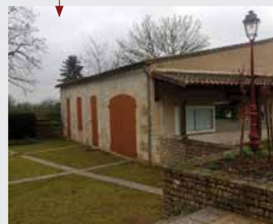
Ancienne garderie avant travaux