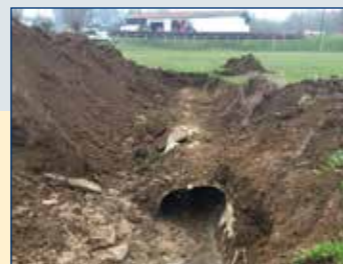
Buse sous l'ancien stade