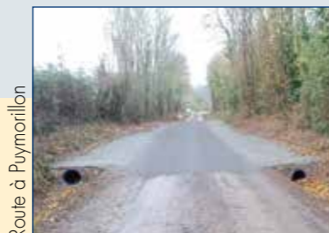
Route à Puymorillon

Une buse d'évacuation des eaux pluviales sous l'ancien stade doit être changée. Les dégâts sont plus importants que prévu.