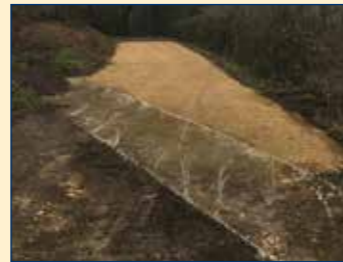
Chemin joignant le lotissement à la lagune