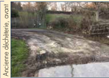
Ancienne déchèterie, avant

Réfection du goudron au niveau du virage de l'ancienne déchèterie. Réparation de la route du tramway. Réfection du chemin qui va du lotissement à la lagune.