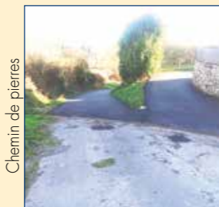
Chemin de pierres

Réfection du chemin en pierres par un « enrobé » sur les voies communales, afin d'éviter la descente récurrente des cailloux. La stabilisation a été effectuée jusqu'au lavoir, ce dernier étant régulièrement utilisé par des engins agricoles.