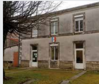
Mairie avant travaux

Le projet de restructuration de la mairie consiste à redéfinir les espaces de travail afin de répondre aux attentes des collaborateurs et des habitants, en travaillant sur la mobilité et l'accessibilité pour toutes les personnes. La mairie se doit d'être un lieu de communication et de convivialité où il fait bon venir.