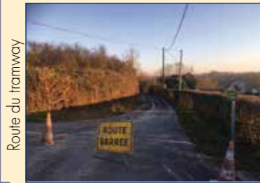
Route du tramway