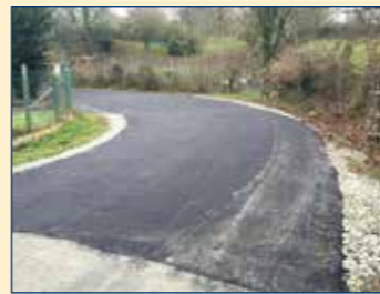
Ancienne déchèterie, après